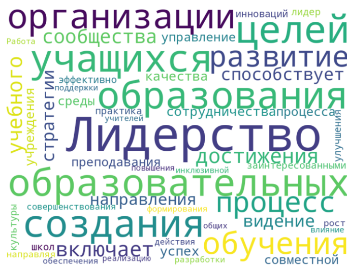
Рисунок 3 – Облако определений понятия «лидерство» в образовании

Итак, мы определили, что такое лидерство и кем является образовательный лидер.