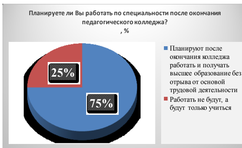
Рис. 4 – Планы студентов относительно работы по специальности