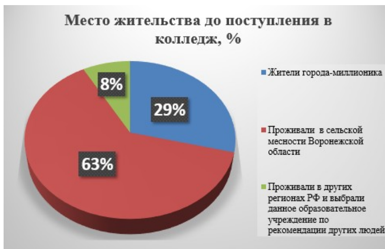
Рис. 1 – Место жительства до поступления в колледж

Анализ полученных результатов представлен в таблице 1.