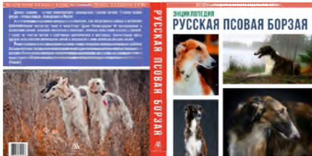
Рис. 1 – Оформление обложки энциклопедии «Русская борзая»

Рассмотрим примеры студенческих работ, в которых применяются выше изложенные принципы построения композиции. Для полного представления специфики работы дизайнера необходимо также коснуться технической стороны дела и рассмотреть, с помощью каких компьютерных средств решаются художественные задачи в работе над обложкой книги.