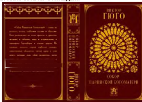
Рис. 4 – Оформление обложки книги В. Гюго «Собор Парижской Богоматери»

Все элементы композиции как бы наклеены друг на друга. Название книги помещено в круг, по центру обложки. В самом низу располагается силуэт города. Эти два элемента создают устойчивость всей композиции. Фон заполнен вертикальными полосами и полями различной ширины. Яркий цветовой акцент вносит вертикальная оранжевая полоса, несколько смещённая от центра вправо. Её поддерживает изображение воздушного шара с белыми и оранжевыми полосками, который смещен несколько влево и вниз от круга с названием книги. В верхнем левом углу располагается вертикальный флажок с надписью «enjoy» оранжевыми буквами по темно-коричневому фону. Все эти элементы расположены асимметрично, но взаимно уравновешивают друг друга. В качестве фона основных элементов использованы оттенки голубого с белыми вкраплениями. В сочетании с небольшими оранжевыми элементами все это создает лёгкое, приподнятое настроение, обещающее приятное прочтение книги о путешествии по интересным местам Новой Зеландии.