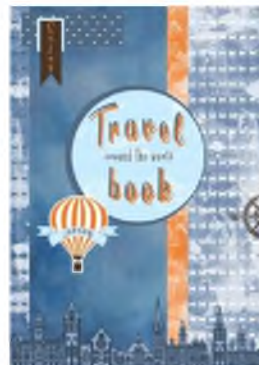
Рис. 3 – Оформление обложки книги Travel book

вершенности, сомнения. Имя автора располагается также по вертикали, набрано черными буквами. Вертикальные направления уравновешивает название книги «МЫ», которое вписывается почти в прямоугольник, приближенный к квадрату. Оно выделено крупными красными буквами. Все это располагается на белом фоне, что создает активный контраст. Сочетание белого, черного и красного вызывает ощущение драматического напряжения.