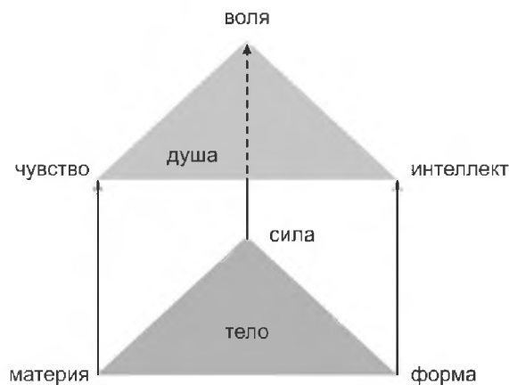
Рис. 1 – Теоретический конструкт человека как предмета воспитания в современной педагогике

внутреннего опыта человека. Таким образом, по своему характеру чувство соответствует материи; мышление – форме (как наша мысль формирует то, что внутри нас, так и каждый орган имеет соответствующую содержанию и выполняемым функциям форму); воля – силе (каждая есть активное начало, которое двигает материю и форму, а также направляет чувство и мысль к известной цели). Все элементы телесной и психической составляющих человека едины, несмотря на различие их проявлений.