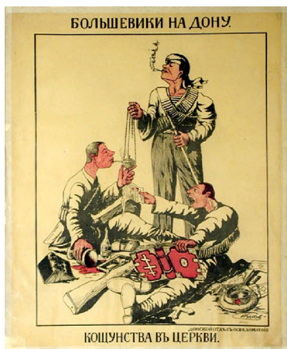
Рис. 2. Большевики на Дону

Отряд Среднего Дона состоял из буксира «Сокол», пассажирского парохода «Венера», пассажирского парохода «Пустовойтов», железной баржи «Кавказ» (на 35 тыс. пудов нефти), двух моторных лодок и двух паромов. Также в отряде имелось некоторое количество деревянных барж и лодок.